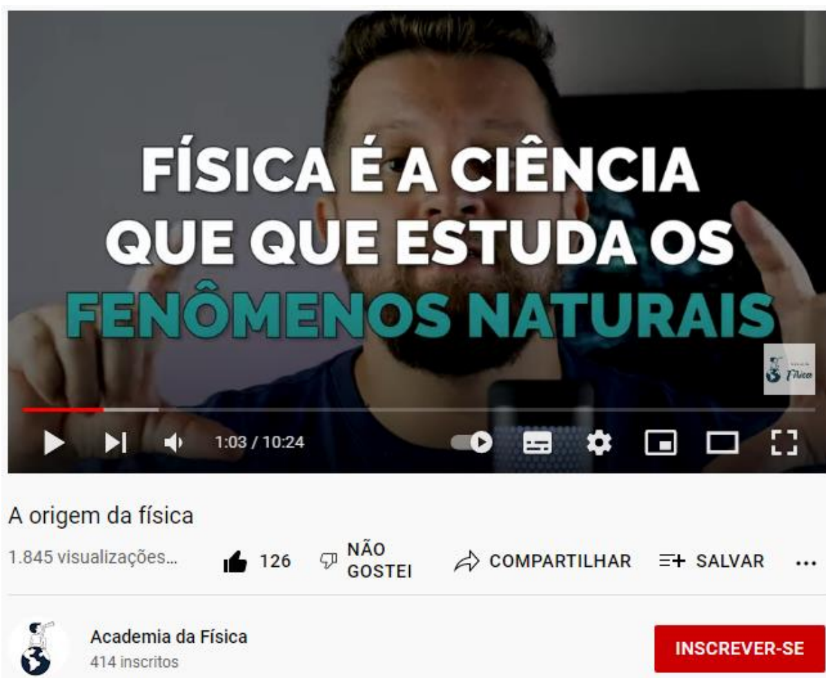
Imagem 1 – Print do Vídeo 1 “A origem da física”